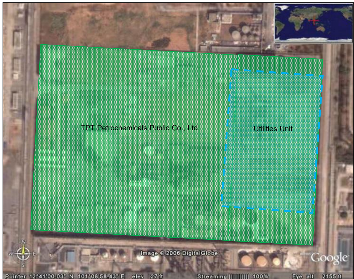
ภาพที่ 1-2 แผนผังแสดงพื้นที่โครงการ